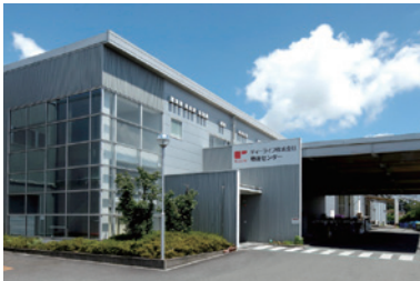
袋井センター 延床面積:6万2429㎡ アクセス:東名袋井ICから2km