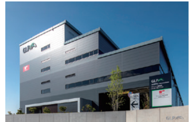
名古屋センター 延床面積:2万324㎡ アクセス:東名守山SICから2.4km