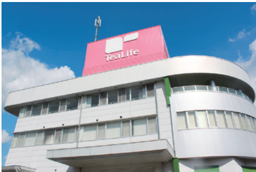
ティーライフ株式会社 本社 新東名島田金谷ICそば