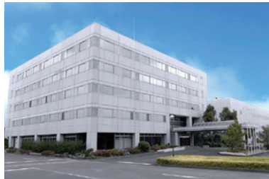
掛川センター 延床面積:2万9191㎡ アクセス:東名掛川ICから4.5km